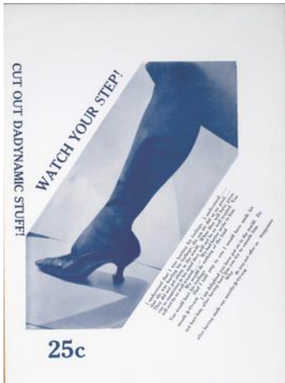
Fig. 4 : « Watch your step », photographie d'Alfred Stieglitz, New York Dada , 1921.