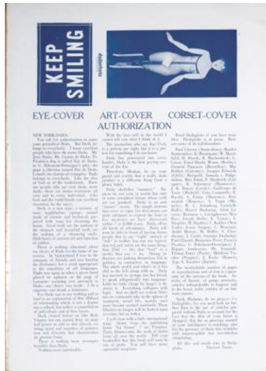
Fig. 5 : Tristan Tzara, « Eye-Cover Art-Cover Corset-Cover Authorization », illustré d'une photographie d'Elsa von Freytag-Loringhoven par Man Ray sous un mannequin articulé, New York Dada , 1921.

Walter Benjamin, « L'œuvre d'art à l'âge de sa reproductibilité technique », Œuvres , III, Folio, p. 105 : « Les dadaïstes attachaient beaucoup moins de prix à l'utilité mercantile de leurs œuvres qu'au fait qu'elles étaient irrécupérables pour qui voulait, devant elles, s'abîmer dans la contemplation. [...] Leurs poèmes sont des salades de mots, ils contiennent des déclamations obscènes et toutes sortes de détritres verbaux proprement inimaginables. Il n'en va pas différemment de leurs tableaux sur lesquels ils collent des boutons ou des tickets de chemin de fer. Par ces moyens, ils détruisent impitoyablement toute aura de leurs produits auxquels, avec les moyens de la production, ils infligèrent le stigmate de la reproduction. »